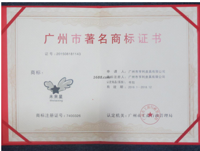
其他证书证明材料