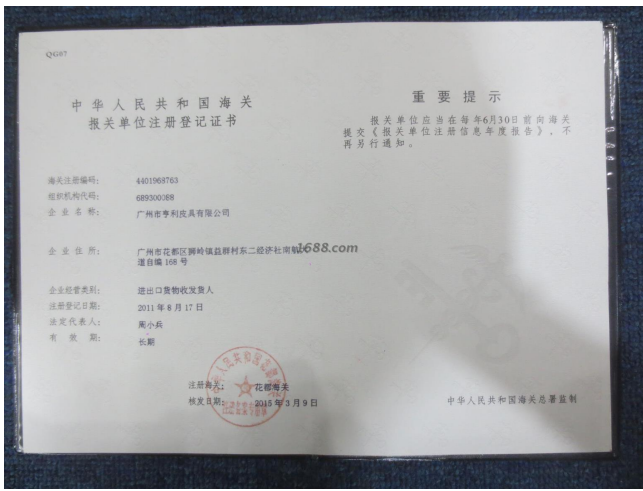
其他证书证明材料